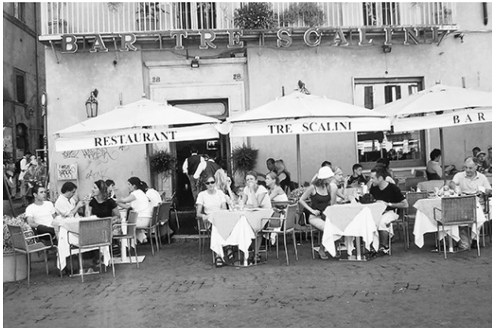
Il ristorante Tre Scalini

Qualche volta vanno° a giocare a biliardo e a calcetto° in un centro giovanile o guardano una partita° di pallacanestro alla televisione.