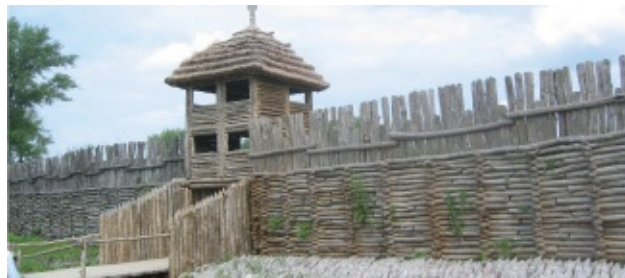
Murallas reconstruidas del poblado de Biskupin (Pomerania, en Polonia). La construcción aprovecha las características del territorio y suelos profundos que permiten la excavación de fosos y abundancia de troncos rectilíneos. Este asentamiento estuvo ocupado desde el siglo VIII hasta el II a. C.

Los materiales de construcción utilizados en los procesos de fortificación están en relación con las disponibilidades de cada lugar. Así, en Oriente Próximo y en Egipto el uso de adobes y tapial fue un constante, sin excluir la utilización de piedra en determinadas construcciones defensivas. En el entorno mediterráneo hubo construcciones realizadas con grandes bloques de piedra, tal es el caso de las ciclópeas fortalezas micénicas de Tirinto y Micenas (siglos XV-XIII, a. C., en Grecia), o de las murallas de la supuesta Troya (siglos XIV-XIII a. C.; Çanakkale, en Turquía). En otros paramentos se usaban piedras de menores dimensiones ligadas con morteros de barro que adquirirían mayor consistencia cuando se mezclaba cal. En las construcciones de tapial también se utilizaron distintas proporciones de cal, y su uso, junto con el adobe, estuvo extendido por todo el Mediterráneo.