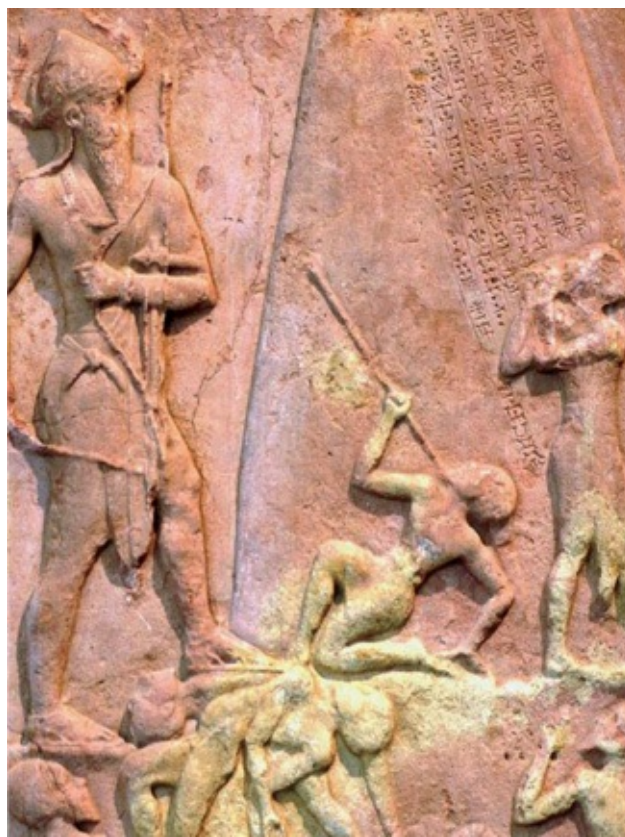
Estela de Naram-sin. Estela del rey acadio Naram-Sin en lucha contra los pueblos montañoses de hacia los años 2254-2218 a. C. Cabe resaltar las armas, sobre todo el arco compuesto de doble curvatura, la más antigua representación de un artefacto de este tipo. Museo del Louvre.

Finalmente, cabe destacar también por su antigüedad la estela de Naram-sin (hacia los años 2250-2218 a. C.) que debe su nombre al rey acadio que llegó a dominar el conjunto de Mesopotamia. En el bajorrelieve aparecen guerreros que forman bajo estandartes y llevan lanzas, hachas, y cascos de cuero. Sin embargo, lo más importante es que aparecen por primera vez arcos compuestos que probablemente tenían un buen alcance y capacidad de penetración. Un instrumento que posibilitaba la guerra a distancia y que revolucionaría las formas de combate.