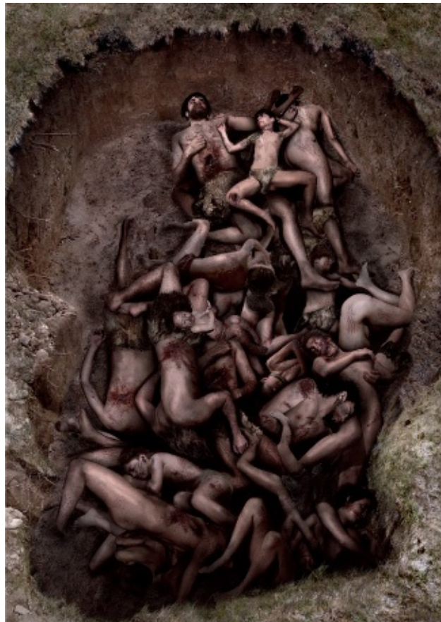
Recreación de la fosa de Talheim (Baden-Wurtemberg, Alemania). Los restos localizados por los arqueólogos pertenecen a familias que podían estar emparentadas y que fueron aniquiladas en un ataque fulminante en el que se utilizaron hachas pulimentadas. Ilustración de Mar H. Pongiluppi.

Este ejemplo de masacre entre campesinos no es el único que conocemos. En las localidades de Asparn-Schletz (Austria) y Manheim (estado de Baden-Wurtemberg, Alemania) también se localizaron yacimientos neolíticos con brutales masacres. Pero los europeos no eran los únicos campesinos irascibles. Las potentísimas murallas de Jericó (Palestina), levantadas a partir del v milenio a. C., indican que las sociedades neolíticas de Oriente Próximo conocían el miedo y la violencia.