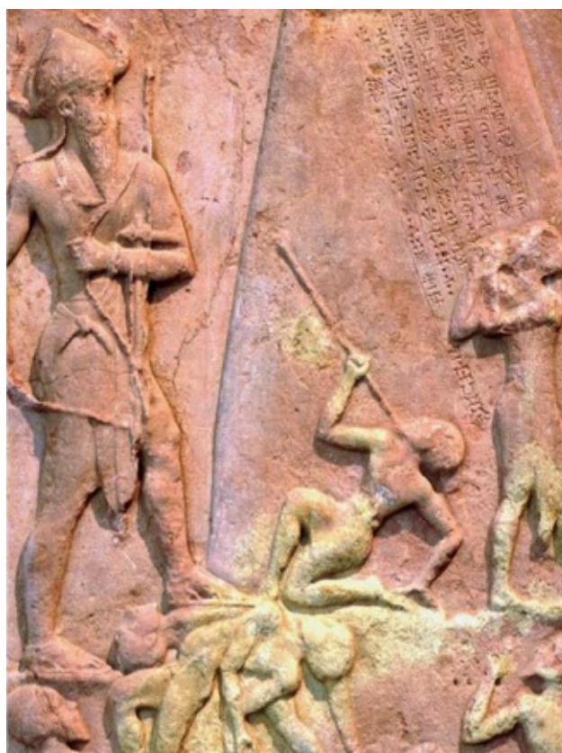
Estela de Naram-sin. Estela del rey acadio Naram-Sin en lucha contra los pueblos montañoses de hacia los años 2254-2218 a. C. Cabe resaltar las armas, sobre todo el arco compuesto de doble curvatura, la más antigua representación de un artefacto de este tipo. Museo del Louvre.

Finalmente, cabe destacar también por su antigüedad la estela de Naram-sin (hacia los años 2250-2218 a. C.) que debe su nombre al rey acadio que llegó a dominar el conjunto de Mesopotamia. En el bajo relieve aparecen guerreros que forman bajo estandartes y llevan lanzas, hachas, y cascos de cuero. Sin embargo, lo más importante es que aparecen por primera vez arcos compuestos que probablemente tenían un buen alcance y capacidad de penetración. Un instrumento que posibilitaba la guerra a distancia y que revolucionaría las formas de combate.