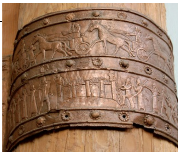
Bajorrelieve del panel de bronce de la puerta del palacio de Salmanasar III en Balawat (actual Iraq) de. En el detalle se observa el asedio y toma de una fortaleza, hacia el siglo IX a. C. Museo Británico.