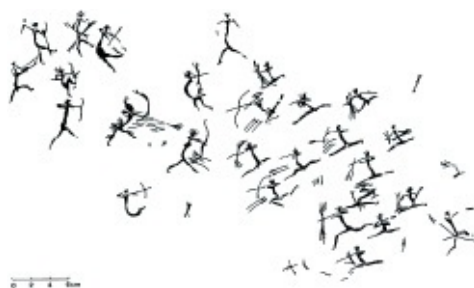
Combate entre arqueros. Abrigo de Les Dogues (Ares del Maestre, Castellón). Dos grupos de arqueros, que se pueden identificar perfectamente, se enfrentan en un combate reglado. A destacar el personaje de mayor tamaño de la izquierda que, probablemente representa a un jefe.

Las escenas descritas y muchas otras de la pintura rupestre levantina nos muestran claras escenas de guerras tribales que, obviamente, eran un referente importante y cotidiano para las gentes de ese momento.