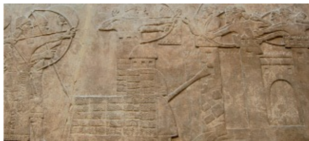
Bajorrelieve del Palacio de Nimrud. Las tropas de Assurbanipal II (669-627 a. C.) asedian una fortaleza utilizando un gran ariete y una torre de asedio. Museo Británico.

Y fue también a lo largo del I milenio a. C. cuando las técnicas y máquinas de expugnación de murallas se desarrollaron poderosamente. Los bajorrelieves asirios de Nínive y Nimrud, que se conservan en el Museo Británico de Londres, muestran zapadores protegidos por escudos de grandes dimensiones, socavando muros de fortalezas. Los mismos bajorrelieves representan también poderosos arietes dotados de fuertes vigas que destruyen murallas y torres desde donde los arqueros dan cobertura a los procesos de derribo.