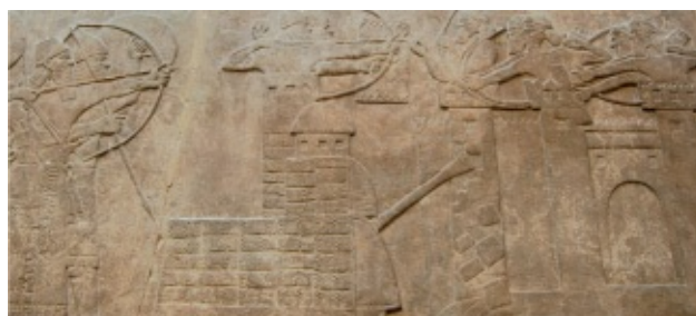
Bajorrelieve del Palacio de Nimrud. Las tropas de Assurbanipal II (669-627 a. C.) asedian una fortaleza utilizando un gran ariete y una torre de asedio. Museo Británico.

Y fue también a lo largo del I milenio a. C. cuando las técnicas y máquinas de expugnación de murallas se desarrollaron poderosamente. Los bajorrelieves asirios de Nínive y Nimrud, que se conservan en el Museo Británico de Londres, muestran zapadores protegidos por escudos de grandes dimensiones, socavando muros de fortalezas. Los mismos bajorrelieves representan también poderosos arietes dotados de fuertes vigas que destruyen murallas y torres desde donde los arqueros dan cobertura a los procesos de derribo.