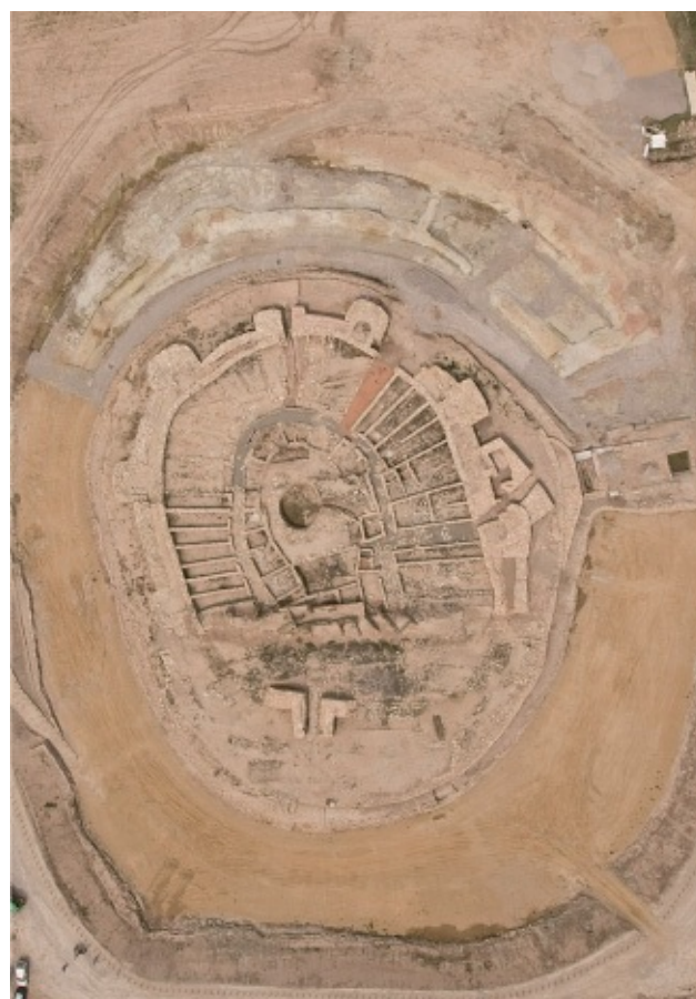
Fortaleza de Vilars de Arbeca (Lleida, en España), de la primera Edad del Hierro (siglo VIII-VI a. C.) y época ibérica (siglos V-IV a. C.). Se pueden observar claramente la gran muralla con sus torres, el foso y el gran pozo central situado en el centro del poblado.

culturales, los íberos y los celtas. Si los íberos se extendían por el litoral mediterráneo y el valle de Guadalquivir, los celtas habitaban el centro y el norte de la península. La influencia mutua generaba por otra parte, grandes áreas de transición celtíberas. Desde el punto de vista de la arquitectura militar de los poblados ibéricos, de los siglos V, IV, III y II a. C., no difieren excesivamente de los castros celtas o celtíberos. Las murallas son el elemento dominante, aunque en el caso íbero suelen ser más reforzadas, sistemáticas y están influidas, en los poblados más relevantes, por la ingeniería militar de los pueblos colonizadores (fenicios y griegos). Contrariamente, íberos y celtas sí que tienen diferencias notables en los aspectos urbanísticos. Hay poblados célticos en los que predominan las construcciones circulares o elípticas, contrariamente, poblados íberos y algunos celtíberos muestran evidencias claras de ordenación urbanística con calles y construcciones cuadrangulares. En este periodo, entre los siglos VIII y II a. C., las tradiciones de fortificación y urbanísticas del Mediterráneo y Oriente presentaban un elevado grado de uniformidad, producto del intercambio de experiencias militares y culturales.